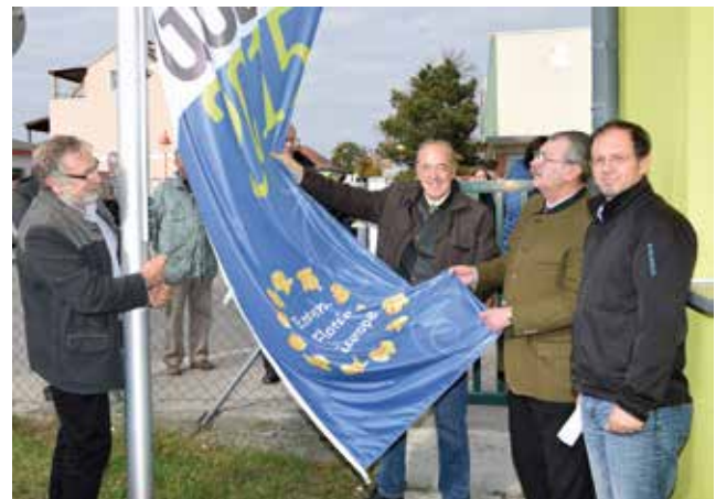
Am Wirtschaftshof (oben) und am Schrankenplatz (links) wurden Fahnen gehisst, um Mödlings Gewinn der Goldmedaille auch öffentlich und stolz zu dokumentieren.