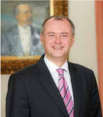
Bürgermeister LAbg. Hans Stefan Hintner

„Der Naturpark Föhrenberge und der neue Fitnesspark im Prießnitztal ermöglichen gesunde und kostenlose Bewegung zu jeder Jahreszeit und für alle Generationen.“