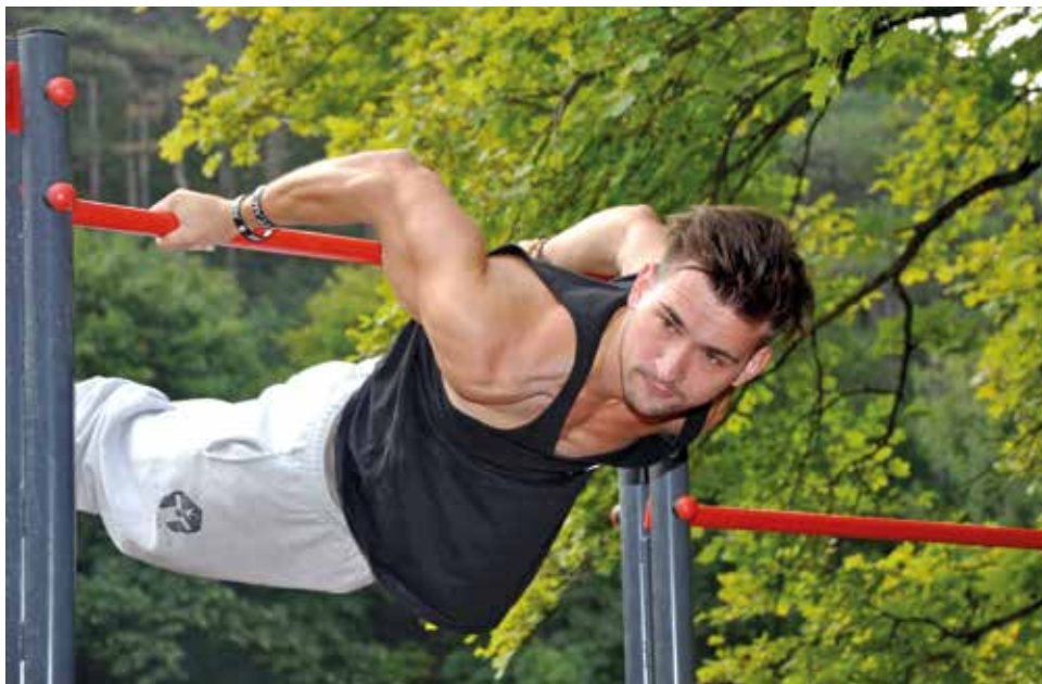
Das „Team Alpha Bar Calisthenics-Verein Österreich“ begeisterte mit spektakulären Vorführungen an den Geräten des neuen Fitnessparks im Prießnitztal.

Am Samstag, dem 12. September, wurde der neue öffentliche Fitnesspark und Spielplatz beim Parkplatz in der Prießnitzgasse eröffnet. In Zusammenarbeit mit der Firma „outfit“ wurde der Spielplatz aufwändig umgebaut und mit vielen attraktiven Sport- und Fitnessgeräten „generationen-fit“ gemacht.