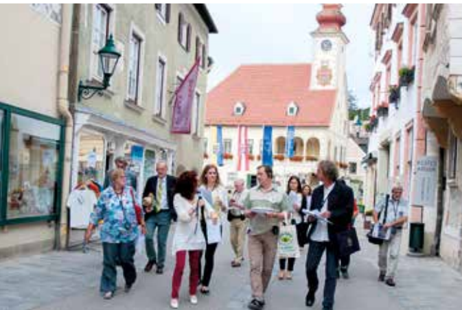
Im Juni war die internationale Jury in Mödling zu Gast und wurde einen Tag lang durch die Stadt geführt (Bild oben und rechts).